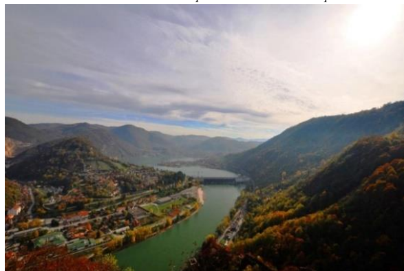
Слика бр.1: општина Мали Зворник